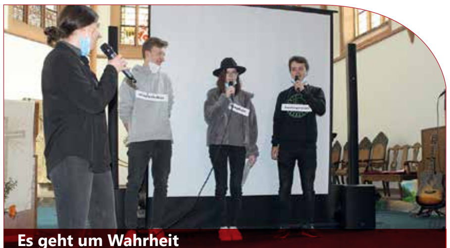
Es geht um Wahrheit